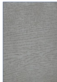
TEINTE GRIS « VIEILLI »