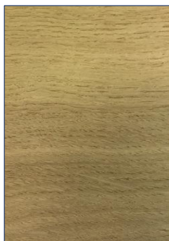
BOIS BRUT, NON TRAITÉ