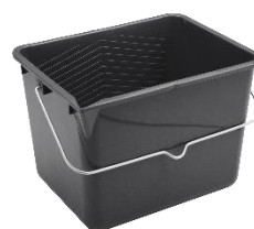
Bac à peinture propre