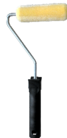
Rouleau en mousse ou floqué pour la version GRIP sur bois lisses