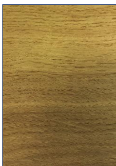
INCOLORE, EFFET MOUILLÉ