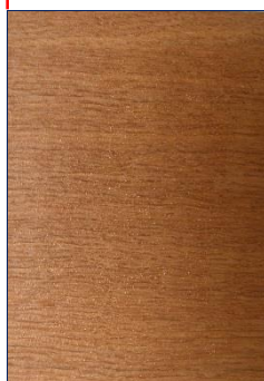
TEINTE CHÊNE CLAIR