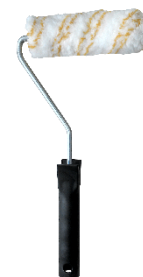
Rouleau laqueur à poils 8 mm pour la version ULTRAGRIP et GRIP sur bois rainurés