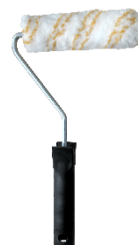
Rouleau laqueur à poils 8 mm pour la version ULTRAGRIP et GRIP sur bois composite rainurés